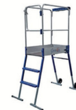
GAZELLE ½ JOURNÉE : 10€ JOURNÉE : 15€