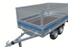
REMORQUE ½ JOURNÉE : 40€ JOURNÉE : 60€