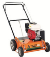
SCARIFICATEUR CARBURANT : SP98 ½ JOURNÉE : 40€ JOURNÉE : 61€