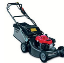
TONDEUSE CARBURANT : SP98 ½ JOURNÉE : 35€ JOURNÉE : 51€