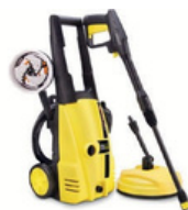
NETTOYEUR HAUTE PRESSION ½ JOURNÉE : 32€ JOURNÉE : 47€