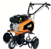
MOTOBINEUSE CARBURANT : SP98 ½ JOURNÉE : 35€ JOURNÉE : 51€