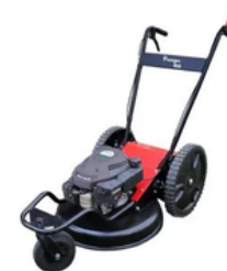
DÉBROUSSAILLEUSE A ROUES CARBURANT : SP 98 ½ JOURNÉE : 40€ JOURNÉE : 70€