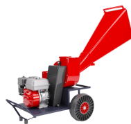
BROYEUR A VEGETAUX CARBURANT : SP98 ½ JOURNÉE : 50€ JOURNÉE : 80€