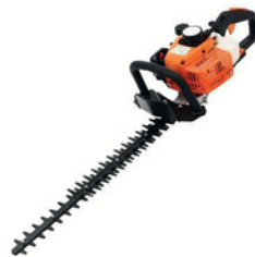
TAILLE-HAIE CARBURANT : MÉLANGE 2 TEMPS ½ JOURNÉE : 26€ JOURNÉE : 37€